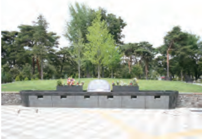
都立小平霊園で人気・注目の「樹林型合葬埋蔵施設」