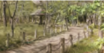
新緑が美しい西原自然公園

4月12日(月)、小平市の新市長に選ばれた小林洋子市長が初登壇した。就任記者会見では、同市初の女性市長ということもあり、女性管理職の増加や、災害時の女性に優しい避難所運営などに質問が集まった。