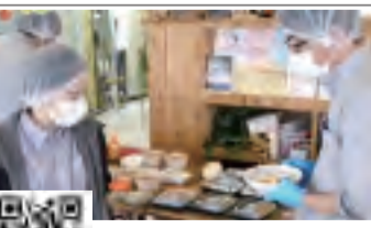
動画の一場面。動画は左のQRコードからアクセス可能

「声の情報」を届けて400回。先月、西東京市で活動する市民団体「保谷朗読ボランティアの会」が発行する「声の情報誌」が、1987年のスタートから約34年を