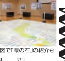
大型日本地図で「県の石」の紹介も

多摩六都科学館で春の特展「県の石」を見てみよう! 開催中。5月9日まで。詳しくは同館(042-469-6100)へ。