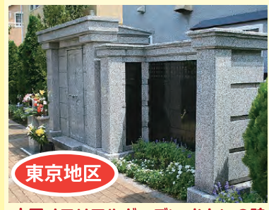
小平メモリアルガーデン おもいの碑 東村山市恩多町 2-29-50