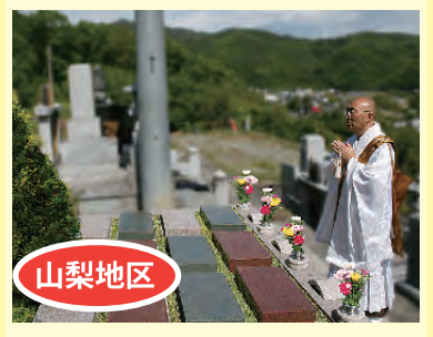
甲府 常説寺 樹木葬緑 バリュープラン 山梨県甲斐市吉沢 714