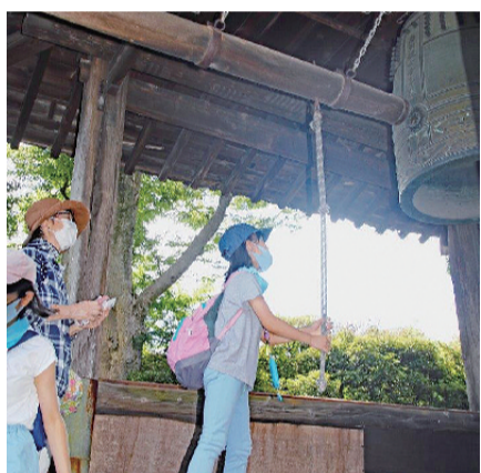
核兵器廃絶や平和を願い、小学生ら約30人が、如意輪寺の鐘を突いた=8月6日

広島・長崎に原爆が投下された日に合わせ、6日と9日、西東京市にある古刹・如意輪寺で慰霊と核兵器廃絶を願う弔鐘が突かれた。世界規模で取り組まれている「平和の鐘」行動に連なるもので、新日本婦人の会西東京支部が主催した。弔鐘は「平和の鐘」として行われたもの。如意