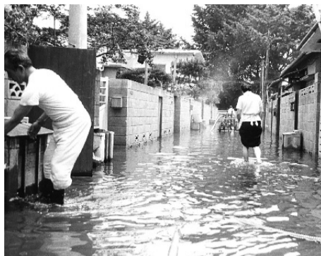
1965年、石神井川の氾濫で浸水した住宅街。下水道事情などは現在とは違うが、この地域でも油断はできないことを示唆している

猛暑続きのなか、一旦雨が降り出せばたちまち豪雨という昨今。台風も本格化するこの時期に、地域の水害の恐れについて調べてみた。洪水や土砂崩れの危険地域はハザードマップで示されているので、一度はチェックしておきたい。