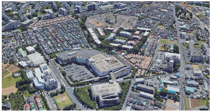
あつモ辺の火葬場跡。東久留米市南沢5丁目イオンモール東久留米からGoogleEarthで撮影。

町の姿はほとんど変わるもの。先日は旧東大農場を横断する都道が一部開通。田無駅南口や小川駅西口などでは整備や再開も進む。そんな変化の激しい時代だからこそ、ときにはちょっと過去を振り返るのも良いのでは？ 東久留米で聞き歩いて得た、知られざる地域の歴史を紹介しよう。