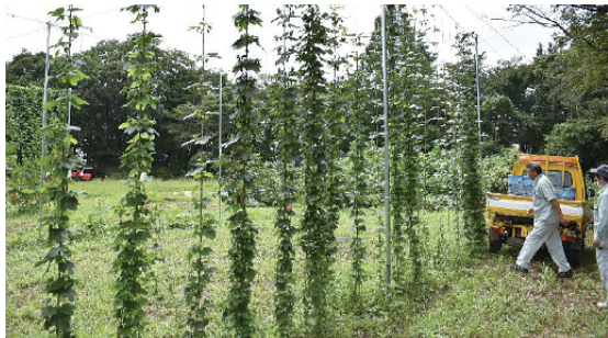
東北など冷涼な地域で栽培されるホップだが、清瀬市では2年続けて収穫に成功した