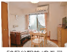
「S保谷駅前」のモデルルーム(※ベッドや家具等は見本。エアコンは完備)

SOMPOグループのサ高住は、25平方メートル超の居心地良い居室で、自由に暮らせるのが特徴。高齢者も入浴しやすい風呂やミニキッチンが標準装備されており、食事は、自炊したり食堂で事前注文したりと、好みに選べる。今紹介する「S保谷駅前」と「S西東京泉町」では、ベッドを飼うことも可能だ。また、「そんな」のサ高住では、元気なシニアはもろろん、認知症や身体マヒなど介護度が進んでいても入居可能。「独り暮らしが不安になった」「静養のために短期的に利用したい」といったニーズの受け皿にもなっている。