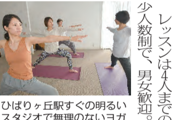
ひばりが丘駅すぐの明るいスタジオで無理のないヨガ