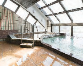
眺望抜群の大浴場

そんな快適・自由な日々を暮らしてみたい。居室は、夫婦二人でもゆったり暮らせるサイズ。年に1回の健康診断など医療面の体制も安心だ。