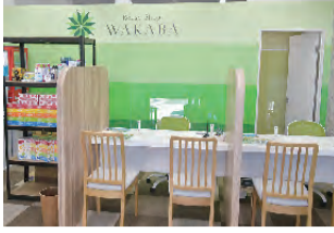
店内は「コロナ」対策万全

「買取品一例」 ◎古銭・外国銭 ◎香水・化粧品 ◎株主優待券 ◎電化製品 ◎貴金属 ◎アクセサリ ◎テレホンカード